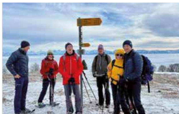
Bilder von der Schneeschuhtour im Jura zum Chasseral mit Hüttenübernachtung in der SAC-Hütte. Jörg Streich